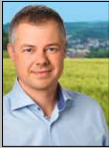
Marco Eyring Bürgermeister der Gemeinde Schlungenbad