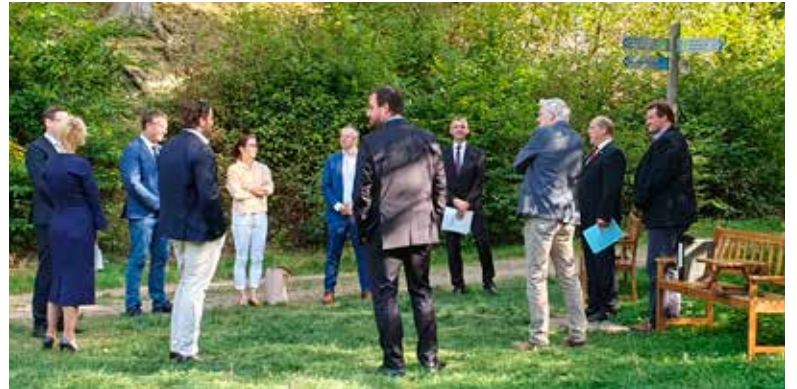
Förderbescheid-Übergabe am Wispersee in Heidenrod.